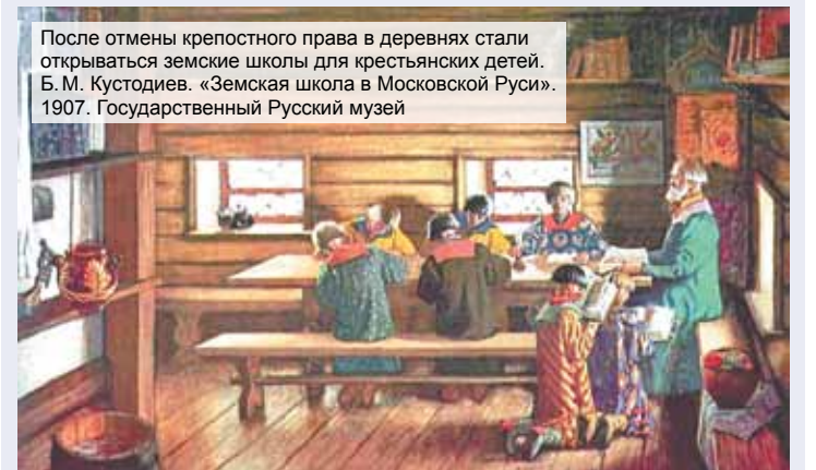
После отмены крепостного права в деревнях стали открываться земские школы для крестьянских детей. Б. М. Кустодиев. «Земская школа в Московской Руси». 1907. Государственный Русский музей

Отмена крепостного права дала импульс развитию и системе общего образования. После реформ в селе Сосенки ведомство госимущества открыло школу, однако спустя несколько лет ведомство прекратило ассигнование образования, передав эту заботу земству. У земств средств на содержание школ не име-